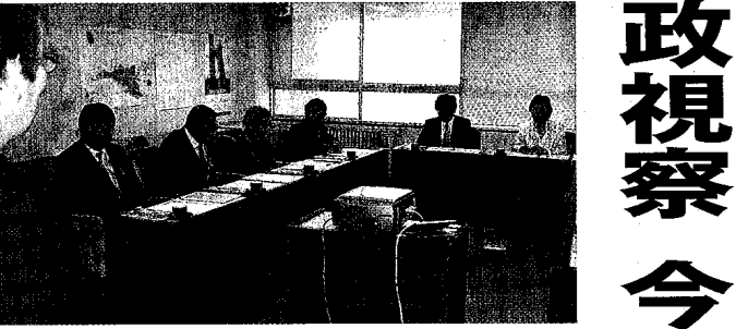
市役所を訪れて説明に聞き入る埼玉県鳩ヶ谷市議会の議員たち(20日)